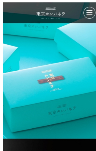
(左)PC サイト(右)スマホサイト